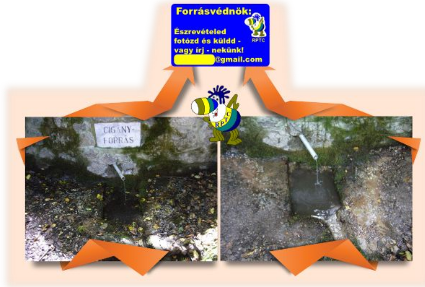
Első alkalommal kihelyezett forrásvédnök tábla a Cigány-forrásnál.

Az újjászervezés során a források egy részére, forrásvédnök táblák kerületek (kihelyezés folyamatban), rajta a védnök e-mail címével, hogy aki arra jár és hibát talál, mielőbb értesítse a védnököt az elküldött fotóval. A fotók érkezése folyamatos, és nem csak a hibát jelzik, hanem tetszés nyilvánításként is. A közeljövőben tervezik egységes védnöktáblák kihelyezését is.