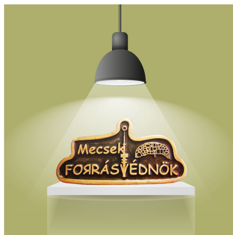
A bronz-fokozatú jelvény.