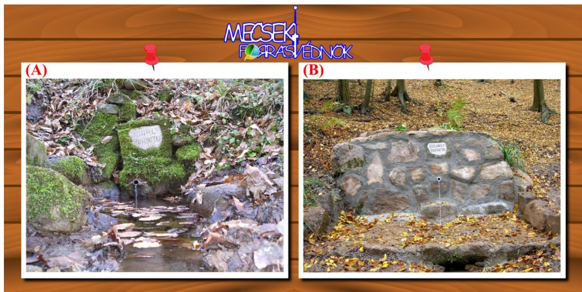
A Mihály Remete-forrás átépítése előtt (A), és 2014-ben (B) felújítása után.

A Mecsek völgyeit számos forrás teszi széppé, változatossá. Jelenleg 250 kiépített forrást, tartunk nyilván. Ehhez a számhoz az erdei forrásokon kívül hozzátartoznak a Mecsek földrajzi egységéhez tartozó, de már lakott területre eső források is. Az összeírásakor nem számoltunk a használaton kívüli forrásokkal. A Mecsek-hegység területén a lakott területeken kívüli forrásokat a Mecsekerdő Zrt. valamint a természetjárók építették és tartották karban évtizedeken keresztül, ahogy ez napjainkban is munkáik közé tartozik. Húsz éve egy új generáció vette át ezt a nemes feladatot és takarítja, óvja az épített forrásokat, méri a források vízhozamát és hőmérsékletét. Szükség szerint megerősítik, újjáépítik azokat az engedélyek beszerzése után.