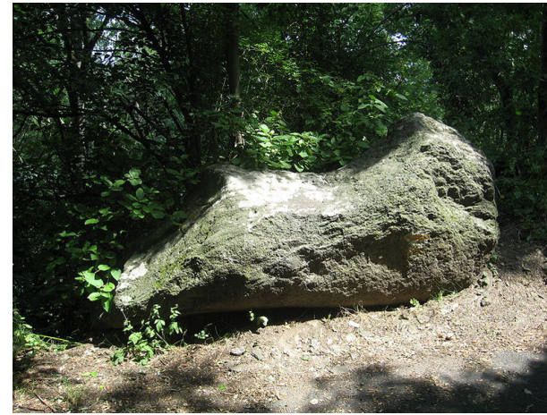
Kinizsi szikla

A monda szerint ezen a sziklán pihent meg Kinizsi Pál, amikor a várat tulajdonába véve felgyalogolt, hogy megszemlélje az ajándékot. Meredek úton elfáradván leült a sziklára és a nehéz teher alatt horpadt be.