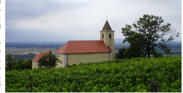
Szent Margit kápolna

Építői a vásárhelyi apácák voltak, építése Mátyás király idejére esik. A török vész idején elpusztult és 1727-ben építették újra az eredeti helyén. Búcsújáráhely lett, 1736-ban már nagy erőszakkal keresték fel messze földről a szép, Szent Margit szüzet ábrázoló oltárképpel díszített kápolnát.