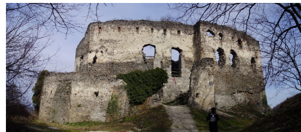
Somló vár bejárata

Fiú örökös híján 1597-ben Csóron János leányai osztoznak a vagyoni, és e vár, Anna kezével Liszthy Istvánnak jutott. 1597-ben a kincstár a Csóron leányok birtoklása ellen pert indít, ami 1626-ban még tart. A zavaros tulajdonjogi viszonyok miatt romló vár állapota folytán az 1597. évi országgyűlés aggódik Somló várának a töröktől való megvédése tekintetében. Vég-