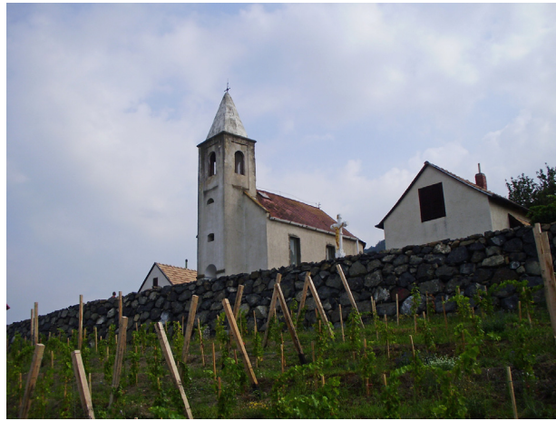
Szent Ilona kápolna