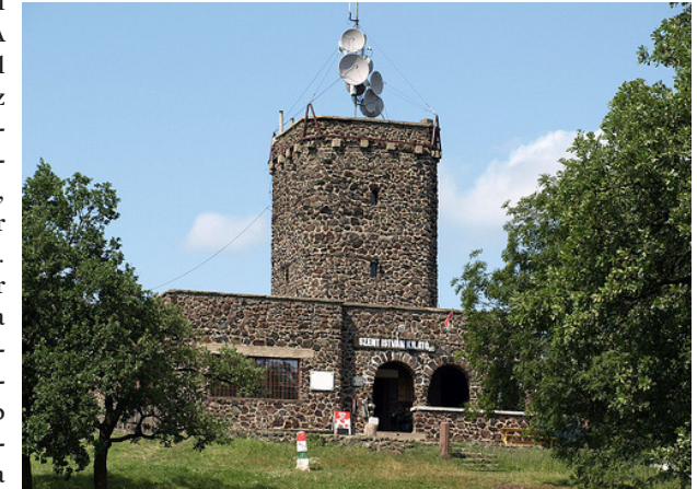
Szent István kilátó

ményt biztosítani a Budapestről Somlóra kirándulók számára. A somlóvásárhelyi vasútállomásról pedig turistajelzéseket állítottak az ide érkezőknek. Ugyancsak a „Somló” osztály érdeme volt a menedékház és kilátó-torony megépítése, melynek felavatása, mintegy hatezer főnyi közönség jelenlétében, 1931. július 12-én zajlott le. A 7 méter magas kilátó az egykori lárma-fa helyén, a hegy legmagasabb pontján épült. A toronyba feljutó kiránduló szemei elé egy megkapóan szép látvány tárul. Keletre: a Bakony hegyei egészen a Kab-hegyig; délre: a Balaton csillogó hullámai, Csobánc, Badacsony, Szentgyörgy és Szigliget; nyugaton: Ság-hegy, távolabb az Alpok nyúlványai; északon: Pápa és vidéke, a Kisalföld rónája ejtik bámulatba a turistát.