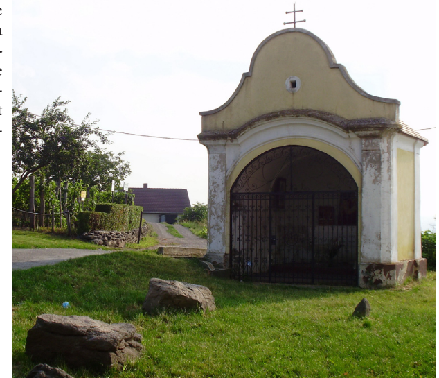
Keresztelő Szent János kápolna

A Margit kápolna mögött áll Keresztelő Szent János tiszteletére emelt kis kápolna. Hajdani felirata ez volt: Ezen fogadásból épült kápolna keresztelő János tiszteletére fog állani. Az út mellett pedig a zivart elhárító, termést megóvó Szent Donát (római legionárius volt) szobra áll.