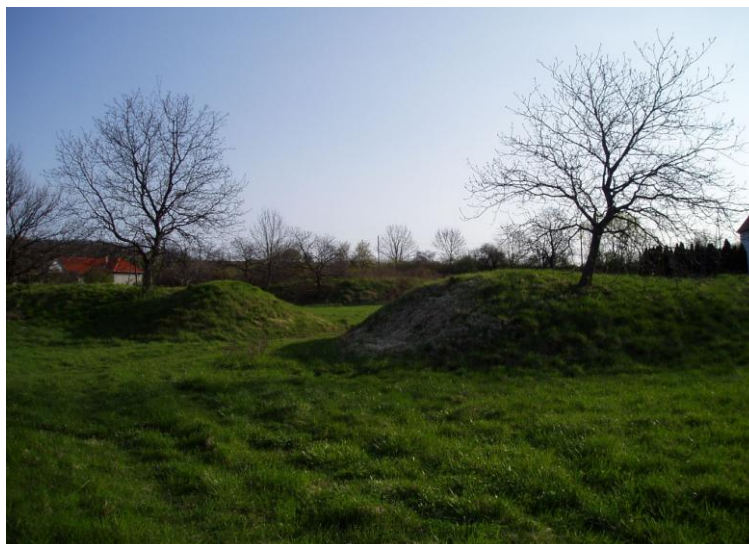
Bozsok Puszta

A bozsoki temető közelében Puszta néven ismert terület található, amely voltaképpen egy középkori eredetű várhely. Védelmi rendszerének központja egy 21 x 15 m-es felszínű, lekerekített sarkú négyszög alakú, vizenyős környezetéből 2,5 m-rel szigetszerűen kiemelkedő domb. A terület vizenyősségét úgy érték el, hogy egy 100 x 75 m-es területet Ny-ról és D-ről mesterséges töltéssel öveztek. É-ről és K-ről pedig lemélyítették a területet. A töltésen később a víz levezetésére és megközelíthetősége érdekében nyílást vágtak. Az 1973-ban történő próba ásatások a töltés földjéből kora császárkor és középkori kerámiatöredékeket hoztak a felszínre. Birtokosai a Csém nemzetségből származó Sibrikek lehettek.