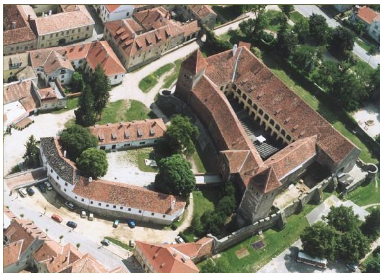
Kőszegi Jurisich vár

Az Alsó-kaput 1780-ban, a Felső-kapu tornyát és a Halász-kaput 1838-ban bontották le. A Chernel utcai torony, egy kör alaprajzú külsőtorony és a városfal tekintélyes maradványai még ma is aránylag