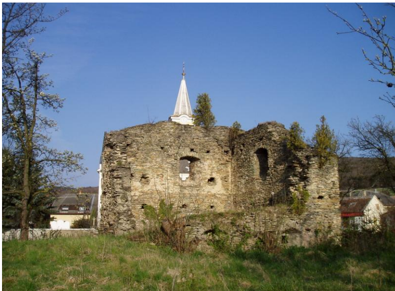
Bozsok vár

Történelmünkben nem szerepel. Az 1616-os években már romként említik.