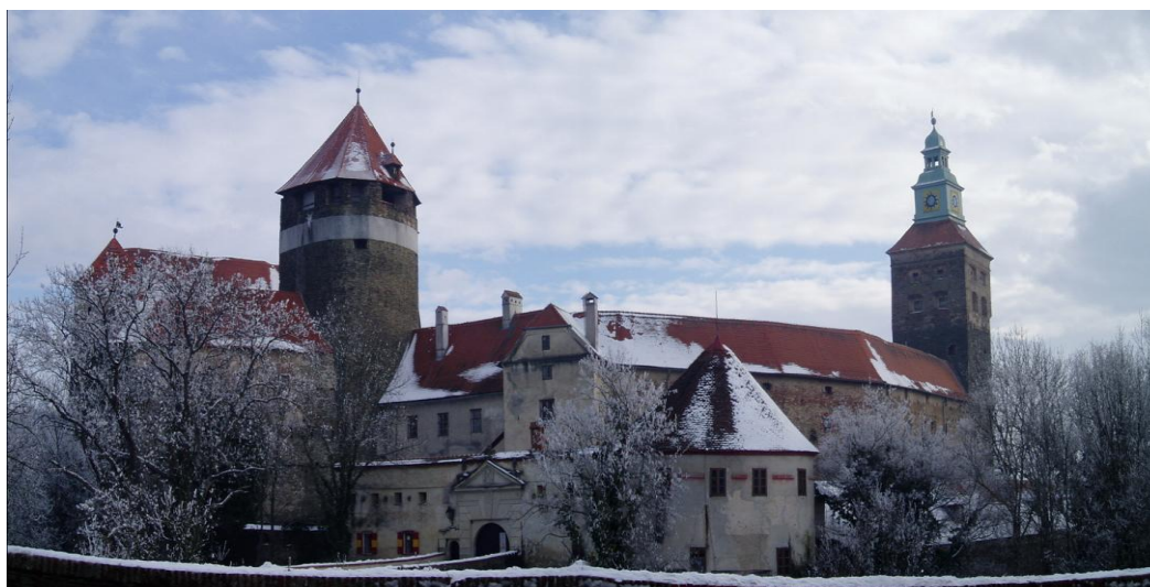
Szalónak lovagvára

Szalónak - százötven évi osztrák közigazgatás után – 1648-ban került vissza Magyarországhoz. A Batthyány-család az első világháború előtt eladta a szalónaki birtokot, amelynek tulajdonjogát-két átmeneti birtokos után-a Budapesti Hermes Bank szerezte meg. A második világháború után a vár elhanyagolt állapotba került. 1956-ban magyar menekültek átmenő tábora volt. Egy évvel később dr. Udo Illig, nyugalmazott osztrák kereskedelmi miniszter vásárolta meg a várat. Az új tulajdonos nagyon sokat tett a szalónaki vár helyreállításáért. 1980-ban a vár a tartomány tulajdonába került. A késő középkori várossal három kapuja közül egy sem maradt ránk és a bástyafalnak is csak töredékeit kímélte meg a történelem. Az egykori erődítmény romjaiból figyelemreméltó egy saroktorony, egy ötszögletes torony és egy bástya.