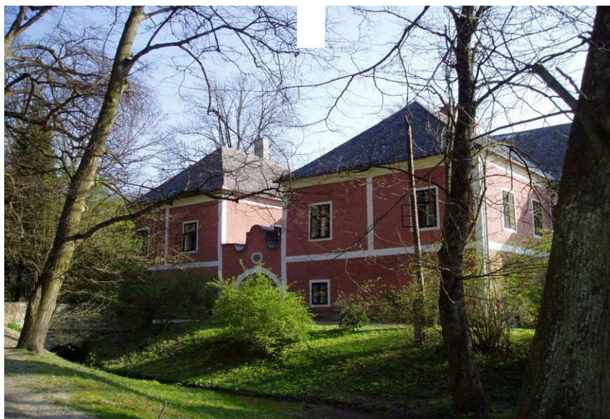
Bozsok Sibrik kastély