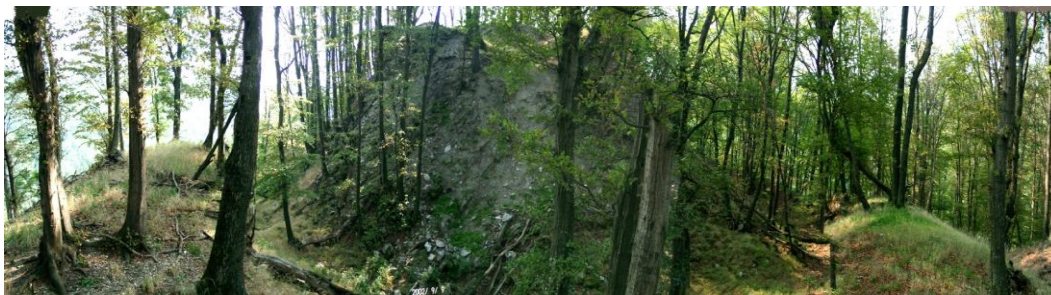
Rohonci vár romjai