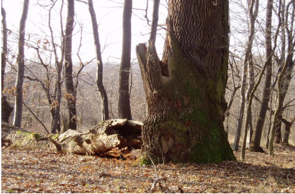
Öreg fák Szentgyörgyvár környékén