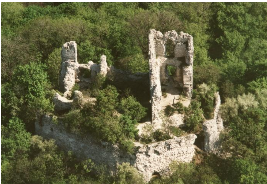
Vitány vár (Civertan Bt)