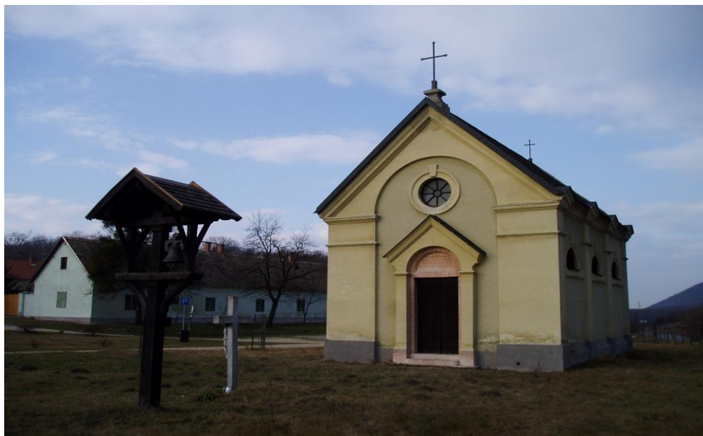
Kőhányáspusztai Eszterházy kápolna