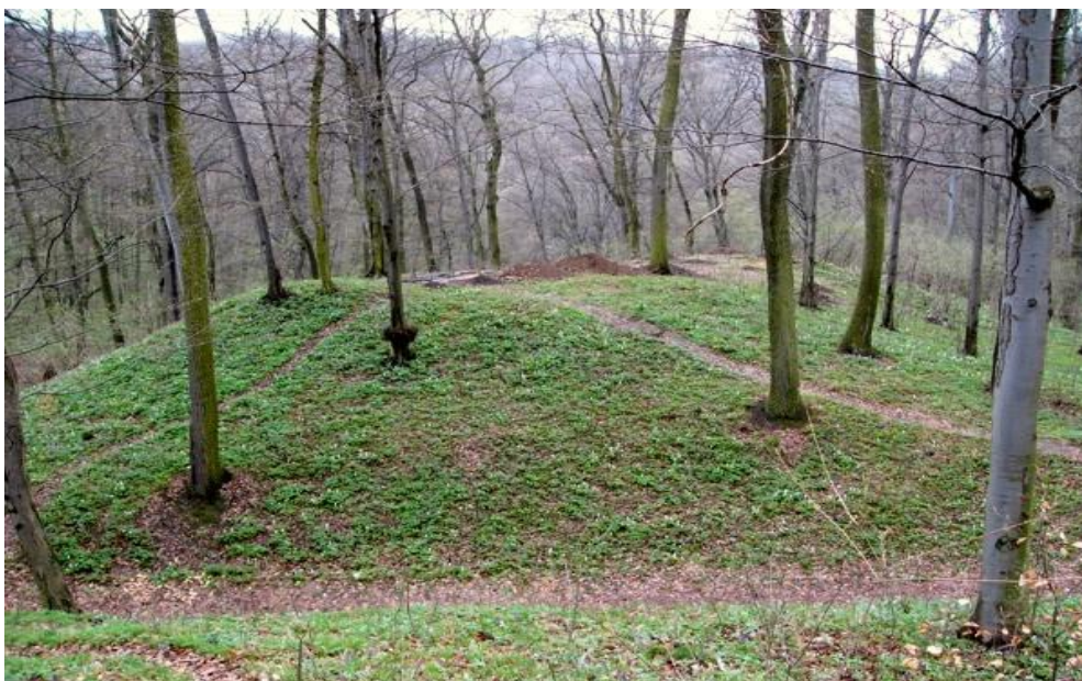
Várgesztes - Kisvár