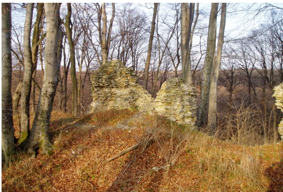
Gerencsér vár