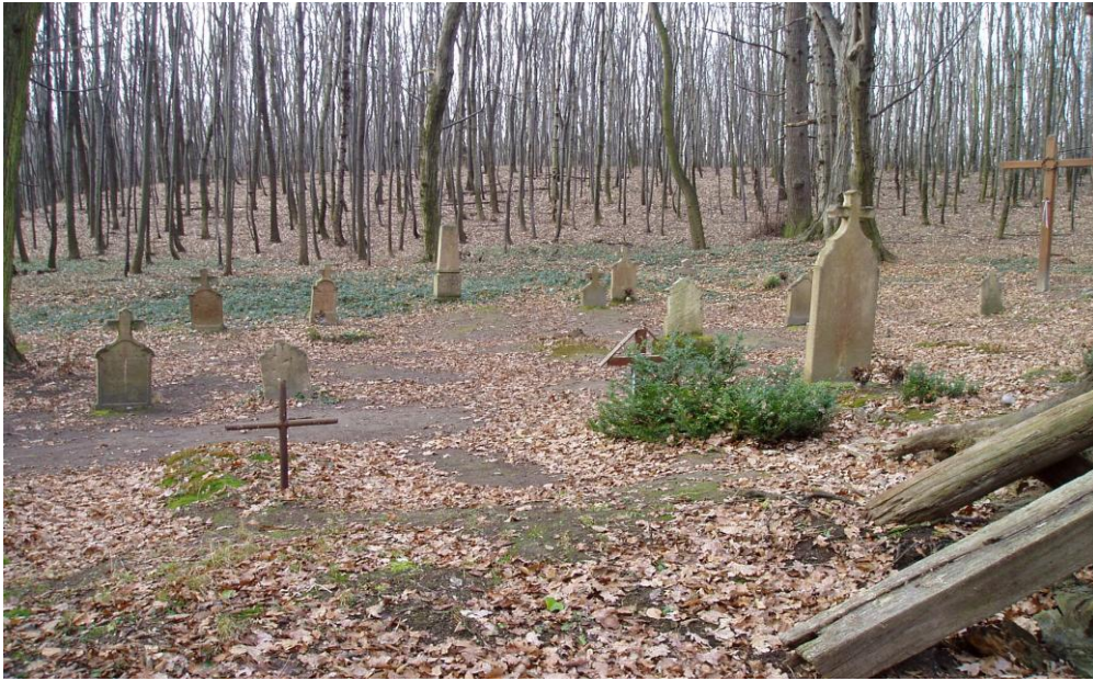
Körtvélyes-pusztai pusztatemető