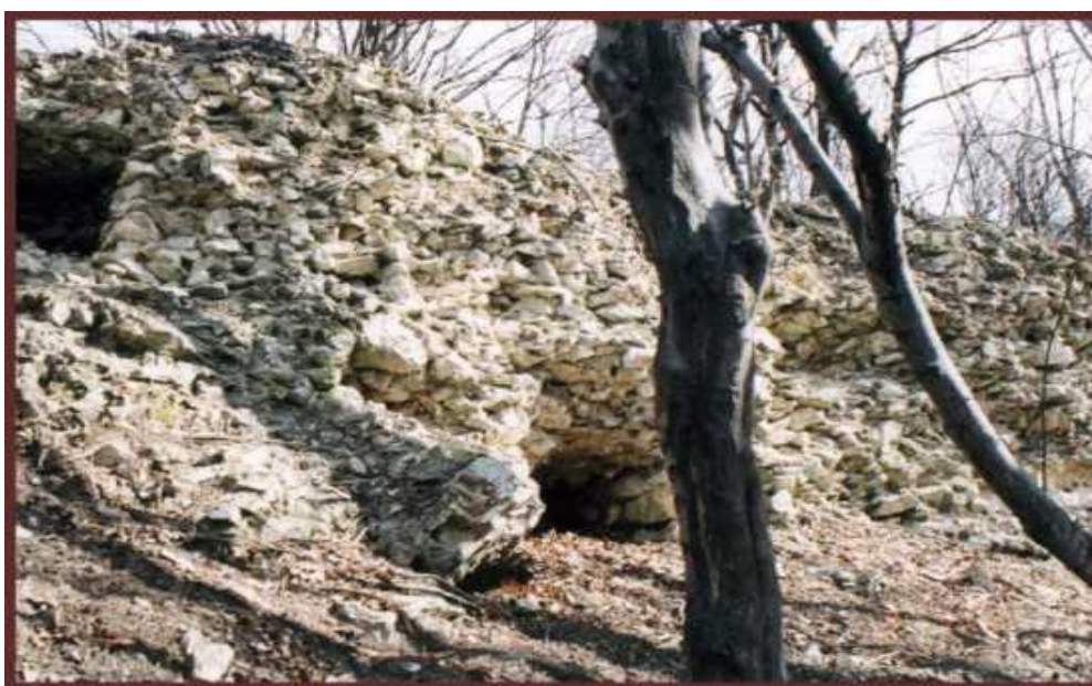
Oroszlánkő (Csákvár) vár