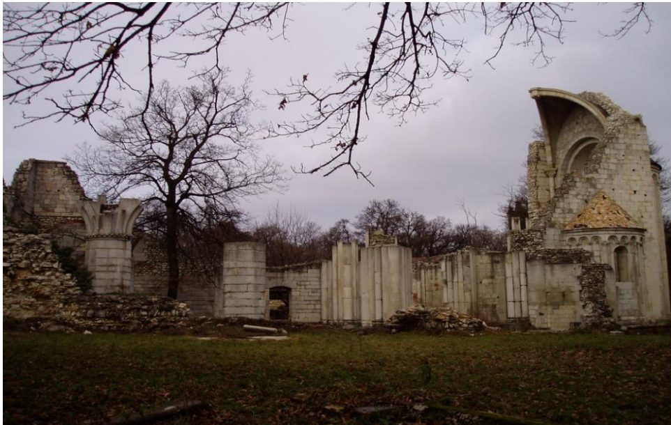
Vértesszentkereszti bencés kolostorromjai