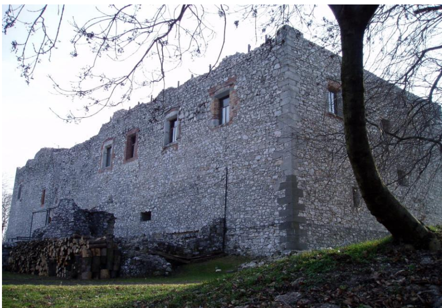
Gesztes vár