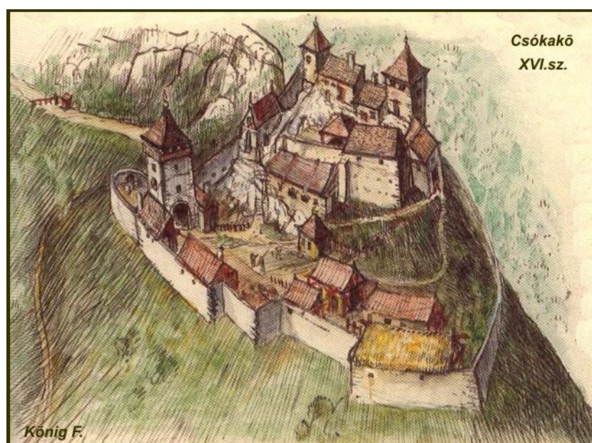
Csókakő (König Frigyes)