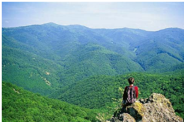
A ma még érintetlen Magas-Börzsöny a Holló-kőről

Cartographia–Berki Zoltán: Börzsöny és az Ipoly völgye turistakalauz bevezetője alapján